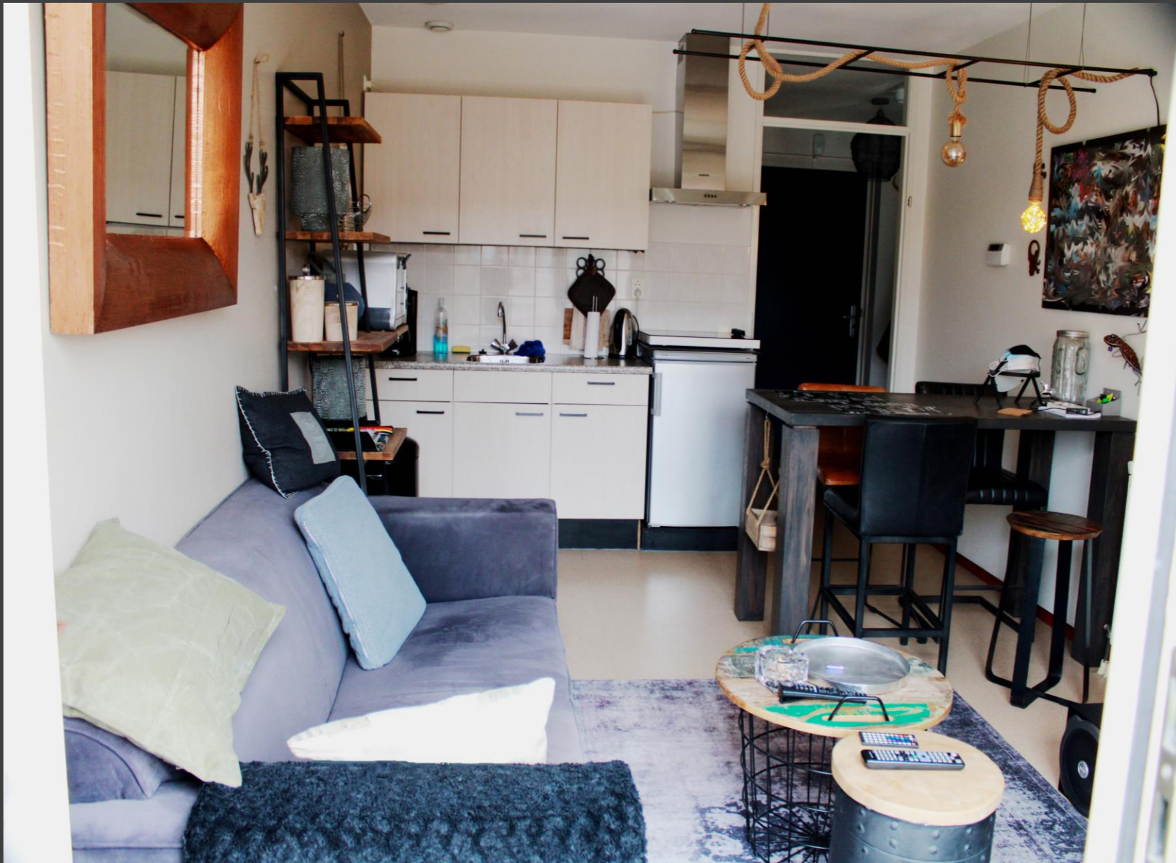
Woonkamer met keukenblok