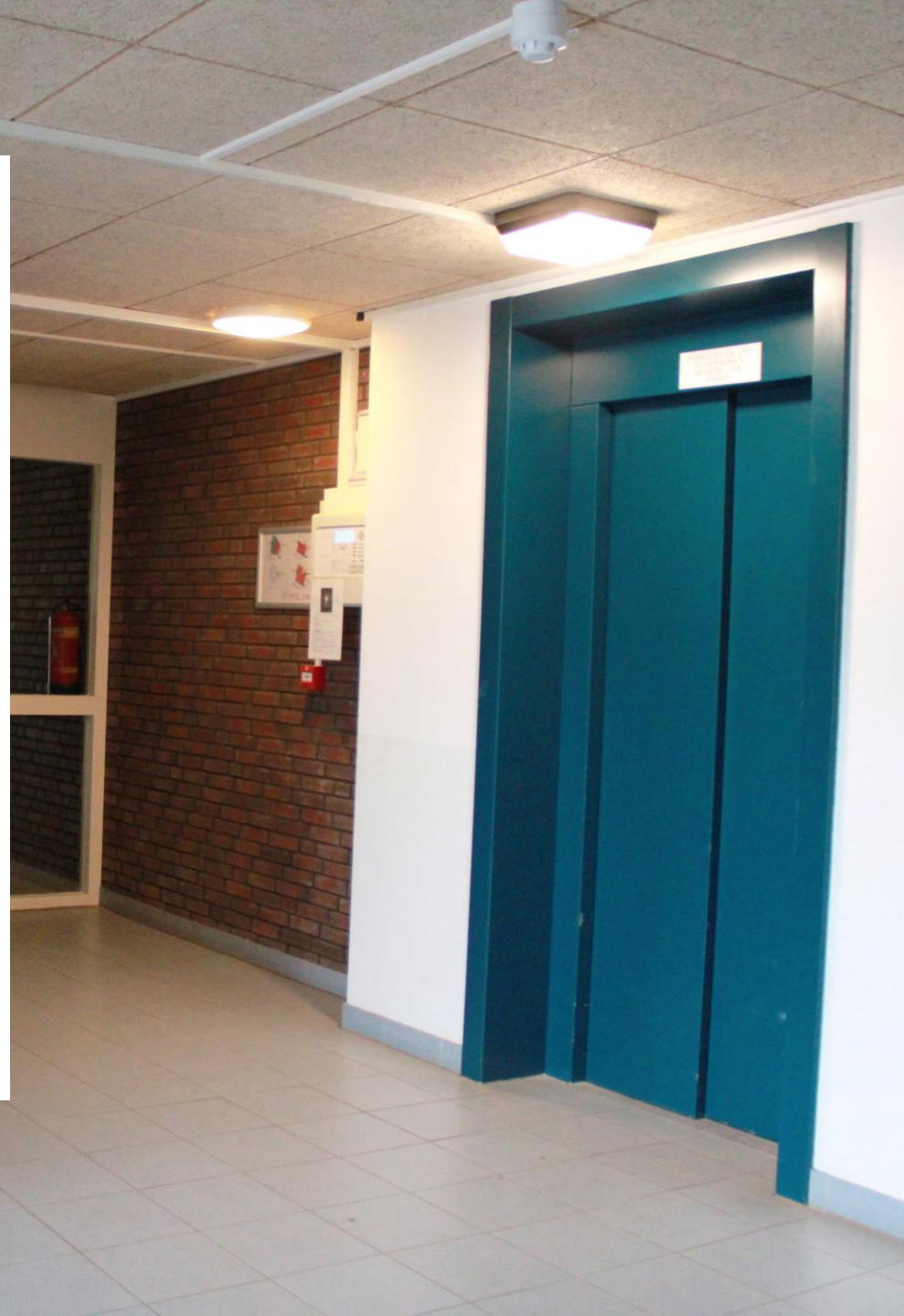
Galerij en lift